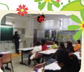
家長們很用心聽講呀！